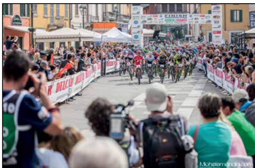
In Piazza S. Maria la partenza dell'ultima edizione.