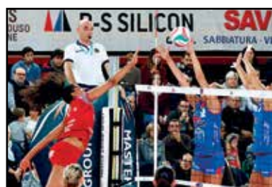
Muro vincente della Metalleghe Sanitars.

Promoball VBF sottolinea che la società non è mai stata interpellata e ha appreso la notizia dal web e dai giornalisti. La società ritiene questo com-