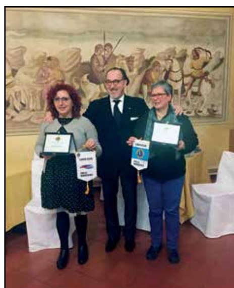
La consegna da parte del presidente Bianchi alla presidentessa e alla direttrice del Consorzio Tenda.

Il Consorzio Tenda, nato dall'Unione di 10 cooperative che da anni lavorano per il servizio alla persona tramite il diretto coinvolgimento della cittadinanza e delle istituzioni, ha tra i propri scopi anche la rieducazione ed il reinserimento sociale degli ex detenuti, svolgendo un percorso che inizia sin dal carcere. Le relatrici hanno ricordato le innumerevoli attività svolte nel carcere, solo da ultimo si ricordino il progetto cachemire con il coinvolgimento di imprenditori direttamente all'interno delle mura carcerarie per creare sin da subito una nuova prospettiva di vita per coloro che hanno violato la legge. Peraltro i lavori di maglieria delle detenute del carcere sono disponibili presso il consorzio tenda ed il ricavato delle vendite verrà destinato in parte alle struttura carceraria per contribuire al mante-