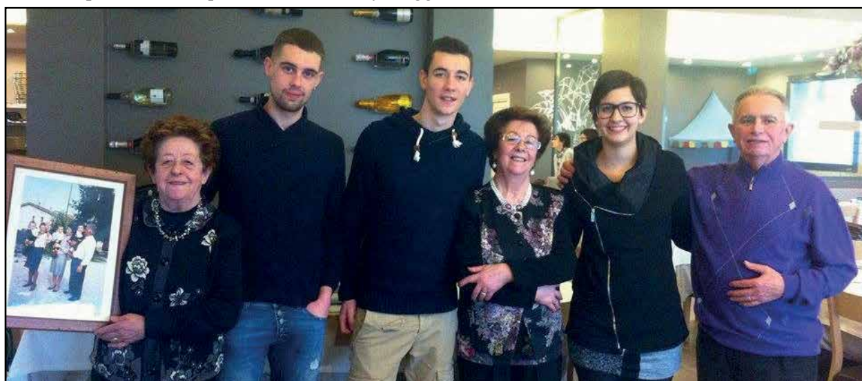
Foto ricordo dei tre nipoti con al fianco i rispettivi nonni.