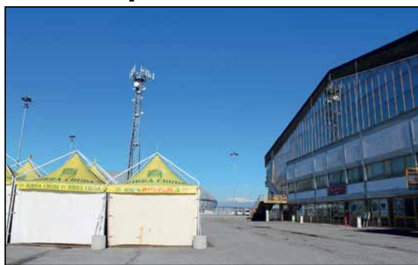
Gazebo per la vendita della birra e altre bibite oltre al bar interno, una fonte certa di guadagno per la presenza di numerosi concerti.

ti, che avevano fatto tanto scalpore nella gestione Badilini, non erano certo nella previsioni dell'allora sindaco Zanola. Come si sa tutto è in divenire, ma il contratto di gestione è rimasto sicuramente a vantaggio della società Time IN. Sicuramente andrebbe quanto meno