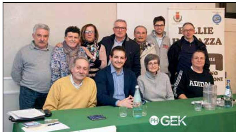
Il nuovo direttivo dell'A.R.C.O.

Il neo Presidente e vice Presidente sapranno dare nuova vitalità all'Associazione con a fianco i consiglieri neo eletti con l'augurio che il Direttivo continui per molti altri anni a venire ad essere presente nella vita della città.