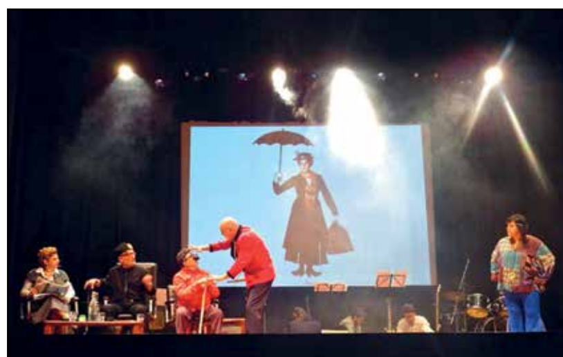
Un'immagine dello spettacolo.

Amministratori locali, alcuni dei quali ancora attivi e presenti allo spettacolo e altri che ci hanno lasciato; fatti di costume e canzoni d'epoca, tutto recitato e cantato dal vivo da ragazzi molto emozionati e meritatamente applauditi, con foto originali che scorrono sullo schermo e accompagnati da un corpo di ballo veramente eccellente! Molti i giovani,